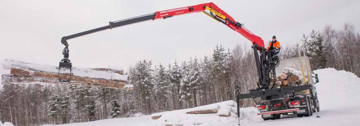
Först ut i det nya lastbilsprogrammet är TZ12, en mellanstor Z-kran för en bred kundgrupp.